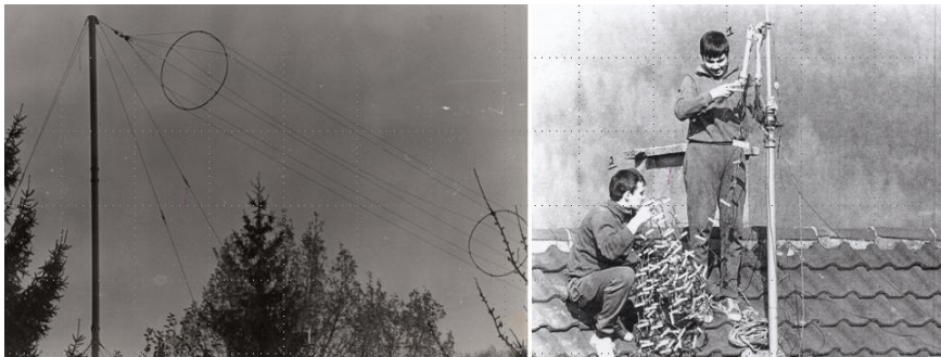
Antenne HF et installation d'une nouvelle antenne HF

Durant ces quinze années de surveillance, Jean informe la SM (poste PSD à partir de 1981) de Baden-Baden sur les évolutions des moyens radio de la MMSL. Outre l'observation visuelle des différentes antennes, il assure une écoute radio.