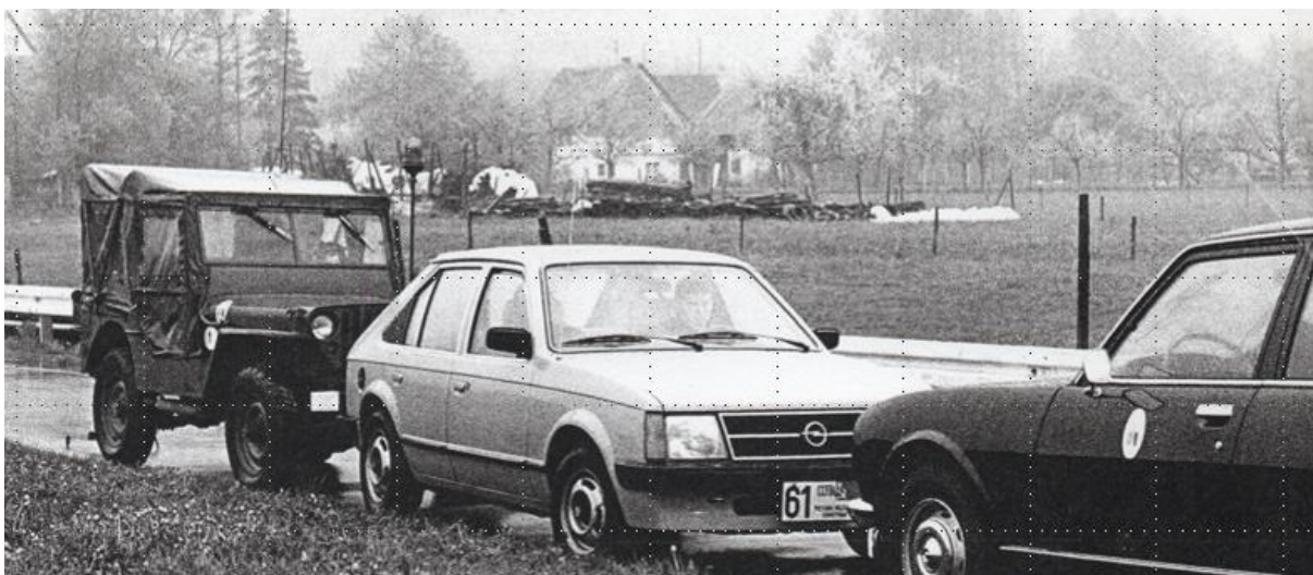
Blocage d'un véhicule de la MMSL par la gendarmerie en zone interdite lors d'une manœuvre de l'OTAN