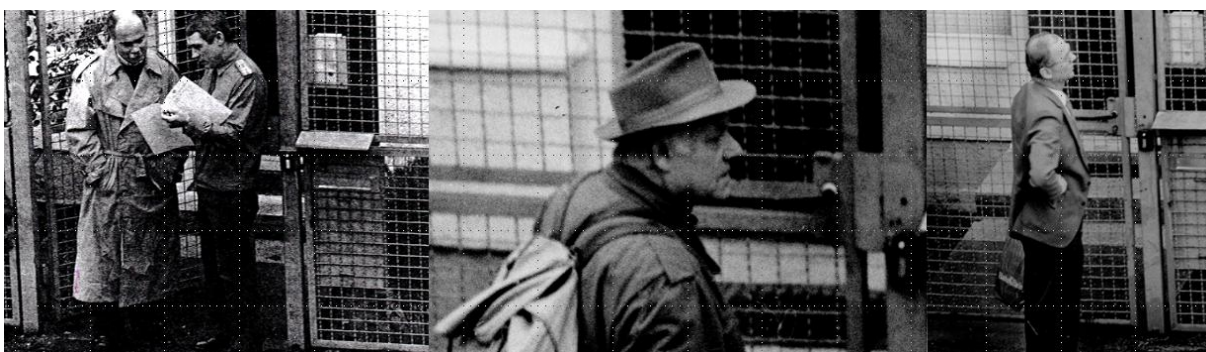
Prises de vue de différents contacts se présentant à la MMSL