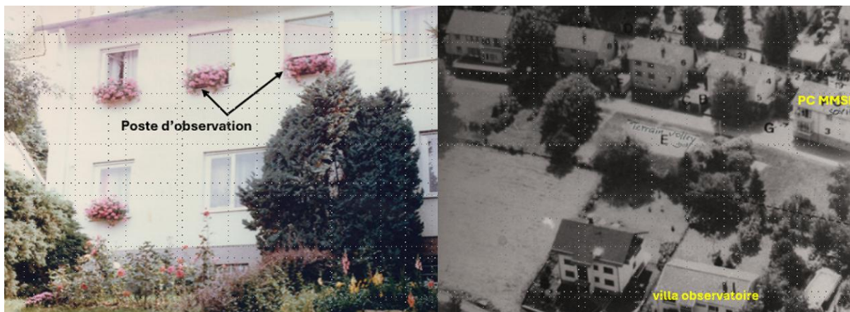
Les géraniums permettent de camoufler le matériel de prise de vue. À l'automne, ils sont remplacés par des bruyères

Ayant rapidement appréhendé ses besoins en matériels, il pousse ses demandes à la SM de Baden-Baden. Les bonnes relations de la SM avec le Militärischen Abschirmdienst, ou MAD (sécurité militaire allemande) favorisent un prêt de matériel complémentaire de la part de ce dernier jusqu'en 1981. Au fur et à mesure, les matériels fournis renforcent ses capacités pour assurer dans de bonnes conditions sa mission de surveillance. Il installe son poste d'observation dans la chambre parentale.