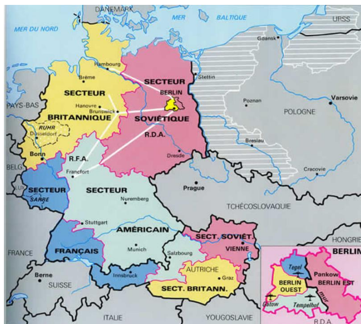
© « 1945, la marche vers la paix », Trésor du patrimoine 2005

Chaque nation occupante a sous son autorité une zone définie (cf. carte).