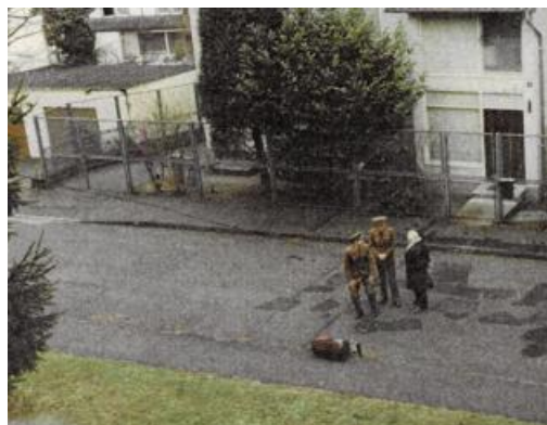
Manifestant devant la MMSL. A noter la hauteur de la clôture