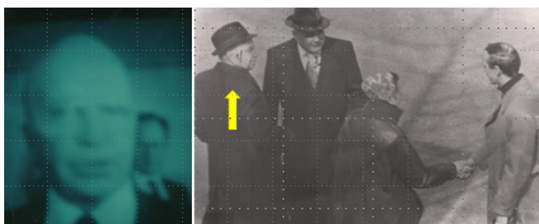
Photo d'écran de télévision Visite de l'ambassadeur SEMIONOV à la MMSL en 1981

Au fil du temps, Jean continue d'étoffer ses moyens, adaptant en conséquence ses propres procédures. Il dispose d'un matériel photographique performant capable d'être utilisé discrètement de nuit, d'un appareil polaroid pour réaliser des photographies immédiatement exploitables, de caméras vidéo et d'enregistreur, de récepteurs radio et même des jumelles de vision nocturne. Afin de suivre les relations germano-soviétiques, il regarde les actualités télévisées allemandes allant jusqu'à prendre des photographies d'écran. Ce mode de récupération de l'information lui permet, en 1981, d'identifier et de signaler la venue, à la MMSL, de l'ambassadeur de l'Union Soviétique en Allemagne.